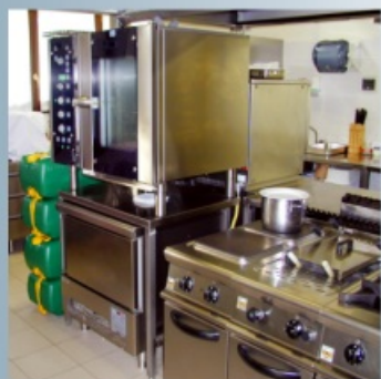
Stapelbar für ein besseres Absetzen

Herausziehbarer „Trolley“- Griff zur Erleichterung von Transportbewegungen bei vollbelastetem Kanister