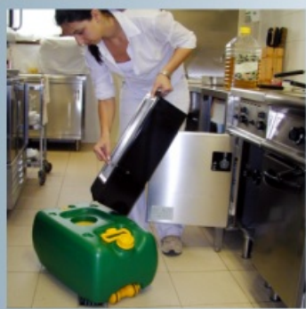
Die Altölenleerung wird dadurch einfacher