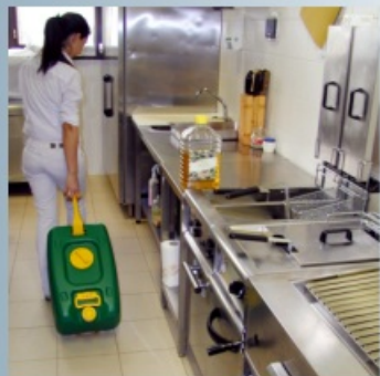
Handlich und bequem zu tragen