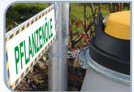
Verzinkter Karabinerhakenverschluss, mit Vorrichtung für Kettenschloss