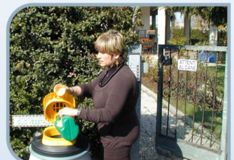
Grosser Verschluss, der das Einfüllen erleichtert, Filter zur Qualitätsverbesserung