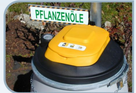
Manuell zu betätigender Deckel mit Kippsicherung und Geruchsfilter